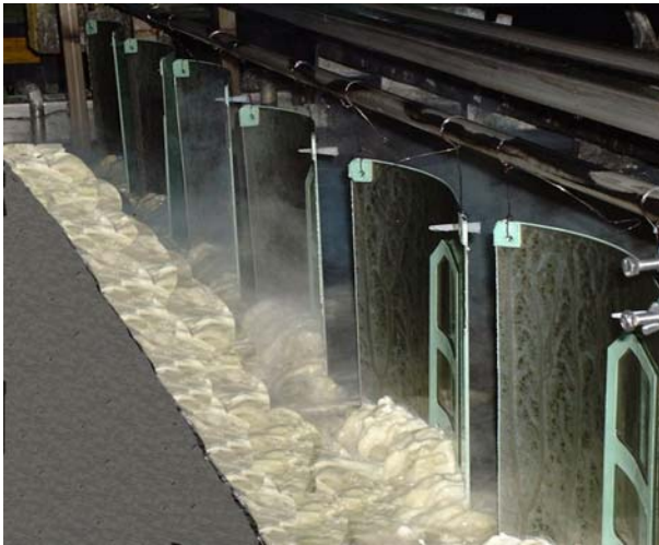
USINAGE CHIMIQUE GRANDE VITESSE